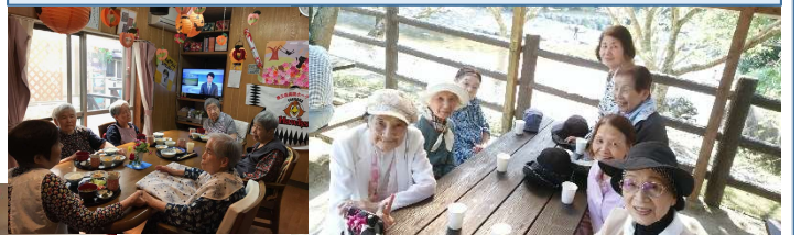
おんせん 調理スタッフ

定員:8名 運営時間:午前9時45分～午後5時15分(月～金) 料金:自己負担額の目安は1日1,300円～2,000円です。 (内食費は1回540円)